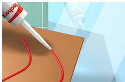
Lastre pesanti e specchi