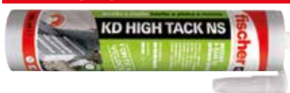
Adesivo sigillante KD HIGH TACK NS